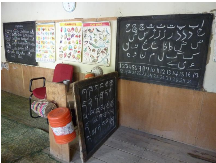
A l'école de Dha, des tableaux en 3 langues et 3 écritures (anglais - tableau de gauche -, ourdou - à droite - , et ladakhi - en bas ) dans la classe de Tsering Ladol, l'institutrice de la Maison des Himalayas.