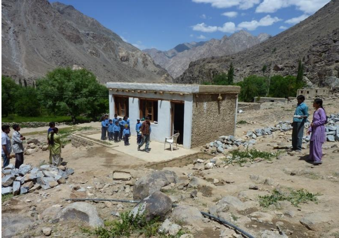
La classe construite à Lasthang par la Maison des Himalayas

Est également en construction une piste qui permettra de gagner le village de Lasthang en jeep. Tous ces progrès représentent de nouvelles chances pour les Dardes et sont au moins partiellement le fruit du travail à long terme de la Maison des Himalayas pour ne pas laisser oublier et disparaître ces villages .